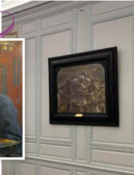
TABLEAU ÉTIENNE DINET

C'est avec un réel plaisir que nous pouvons de nouveau découvrir dans la salle du conseil municipal de notre Mairie d'Héricy, le tableau « les forcenés » d'Etienne DINET.