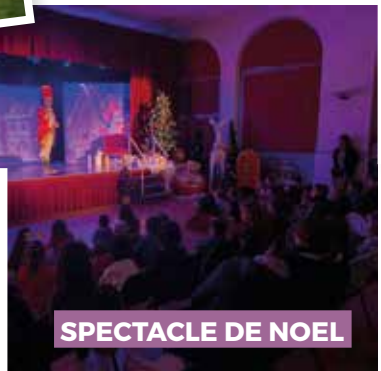
SPECTACLE DE NOEL